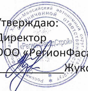
График промывки и прессовки сетей ТС п. Барсово, Белый Яр, Солнечный на 2023г.